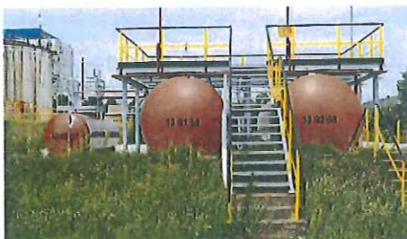
Dwa zbiorniki olejowe leżące po V-50 m 3 oraz jeden o V-10 m 3 .

MMO 4 to trzy stalowe zbiorniki w tym dwa o pojemności 50 m 3 i jeden o pojemności 10 m 3 . Zbiorniki leżące cylindryczne z dnami elipsoidalnymi umiejscowione w tacy przeciwrozlewowej. W odległości około 20 m od zbiorników mazutu. Ciecze o temperaturze zapłonu znacznie przekraczającej 100°C.