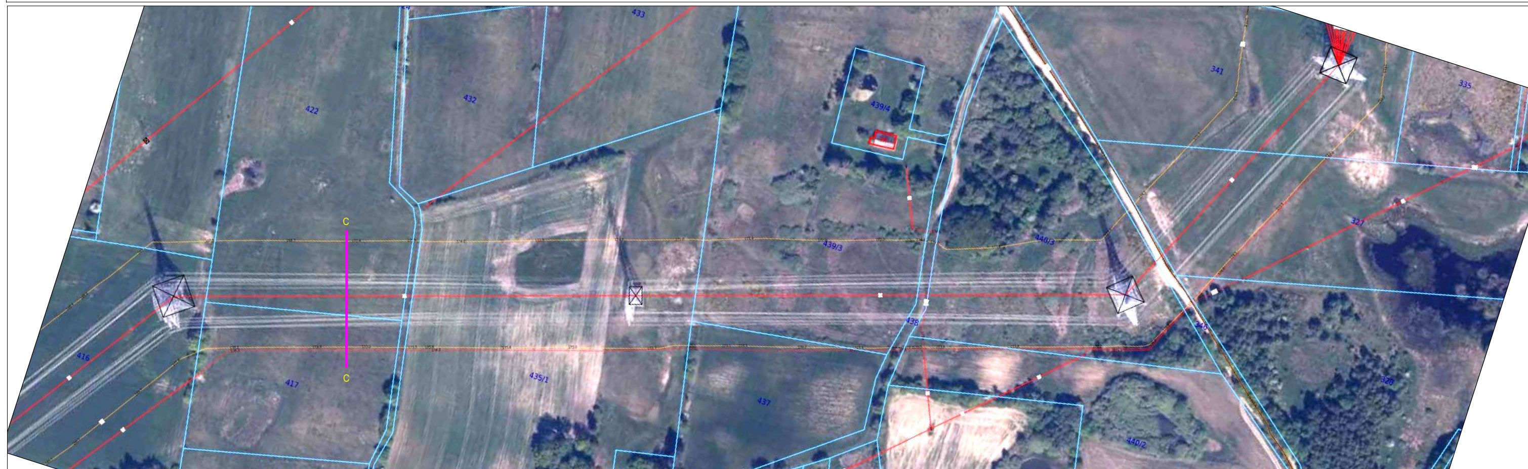
C-C Przekrój pomiarowy pola -E i pola -M