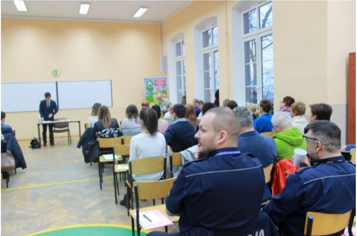
Konferencja w Stargardzie pn. „Działanie organizacji pozarządowych na rzecz rodziny z problemem uzależnień”.