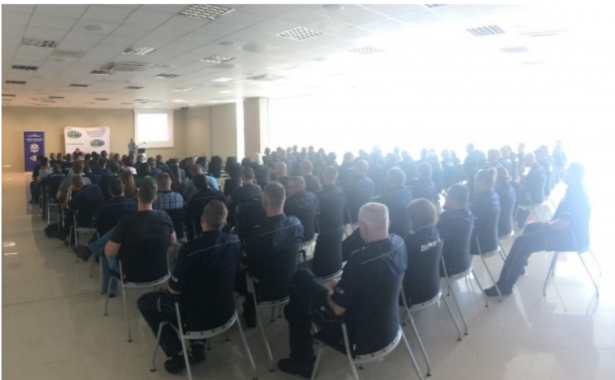
Cykl szkoleń dla funkcjonariuszy Wydziału Ruchu Drogowego nt. uzależnień