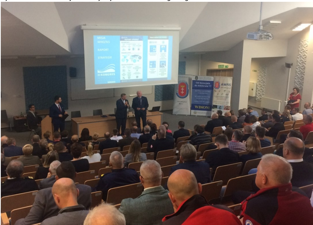
Kongres bezpieczeństwa wodnego