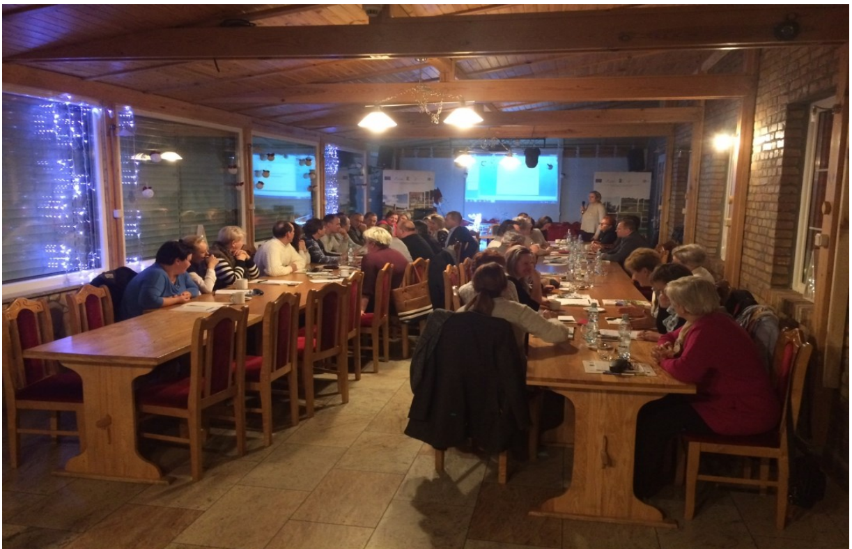
Cykl szkoleń w ramach „Akademii Sołtysa” nt. uzależnień od substancji psychoaktywnych i czynności.