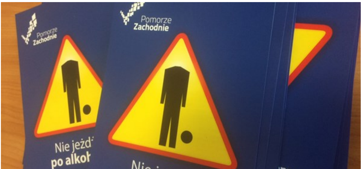
Kampania „Nie jeżdżę po alkoholu”