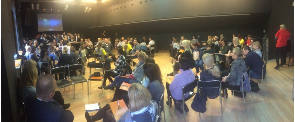
Konferencja dla młodzieży „Sens i bezsens profilaktyki”