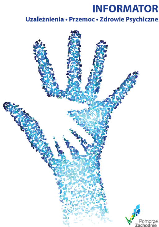
Informator o instytucjach zajmujących się pomocą w województwie zachodniopomorskim