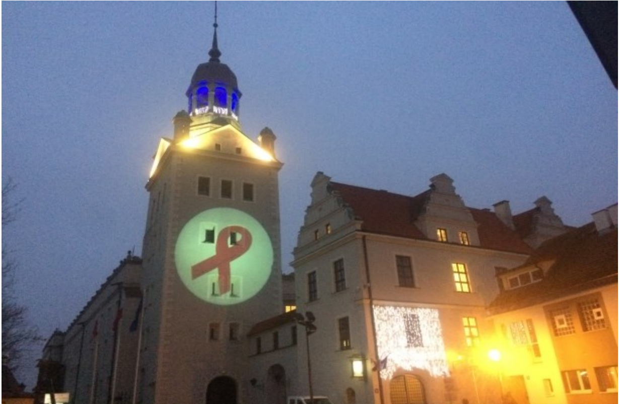
Światowy Dzień HIV/AIDS