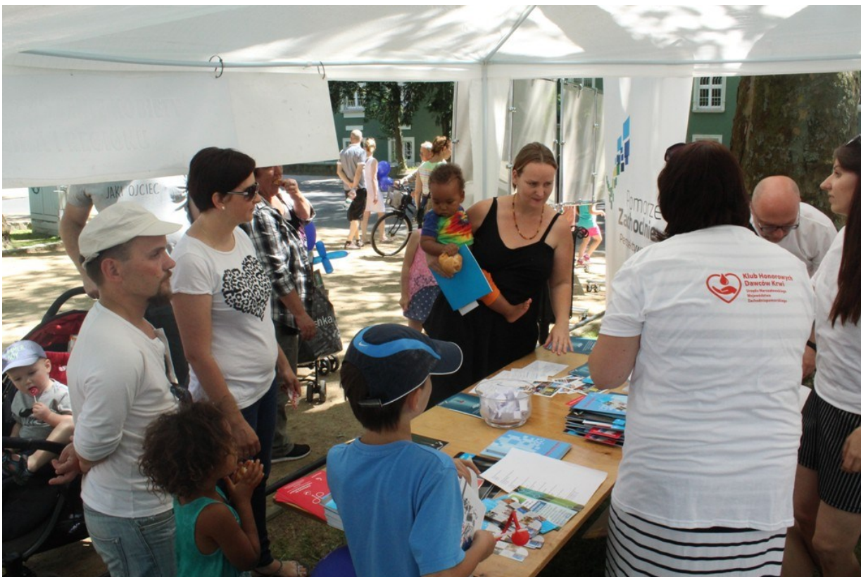
Udział WWS UM WZ w XVI Szczecińskim Spotkaniu Organizacji Pozarządowych POD PLATANAMI