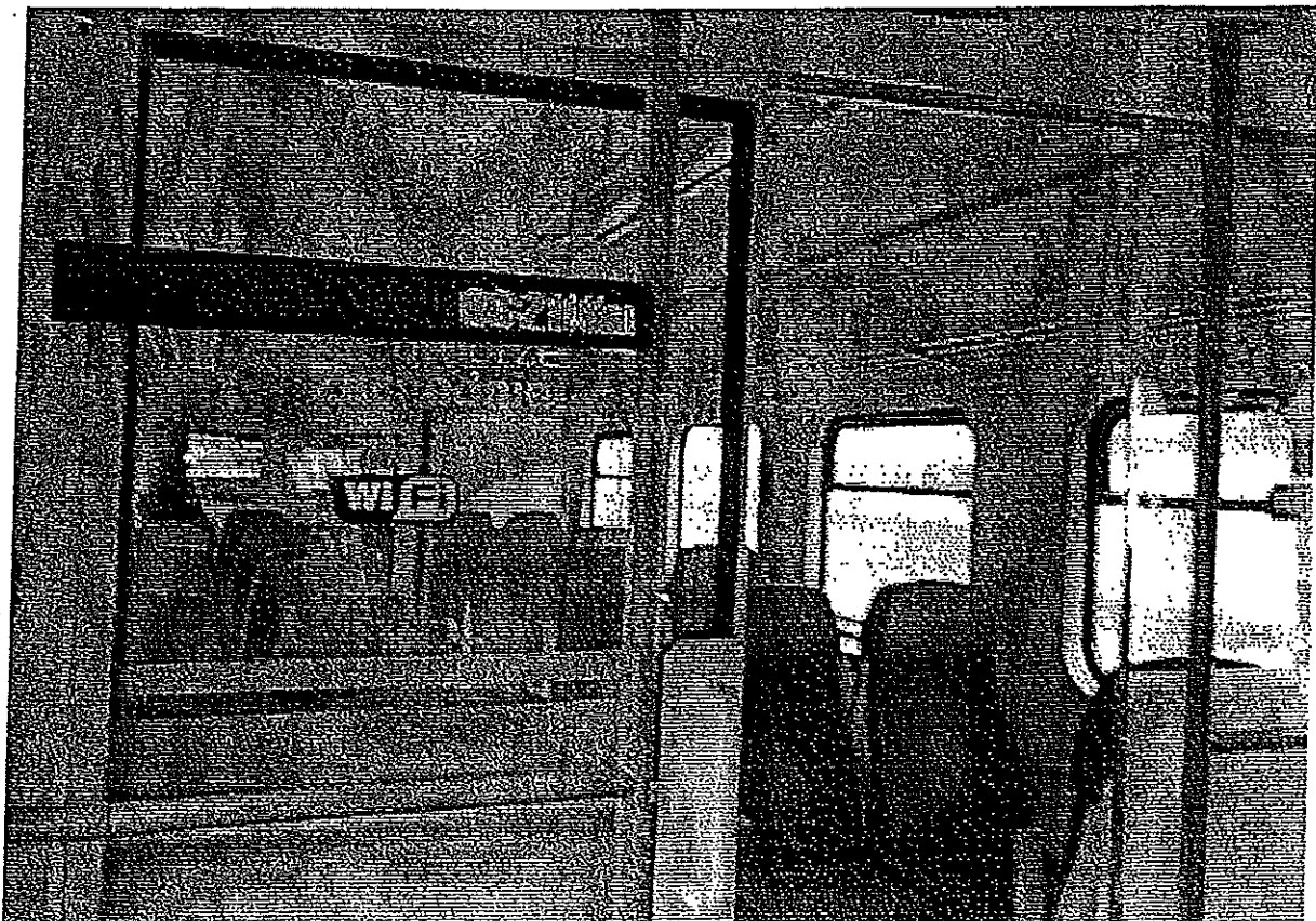
Zmodernizowane wnętrze pojazdu.