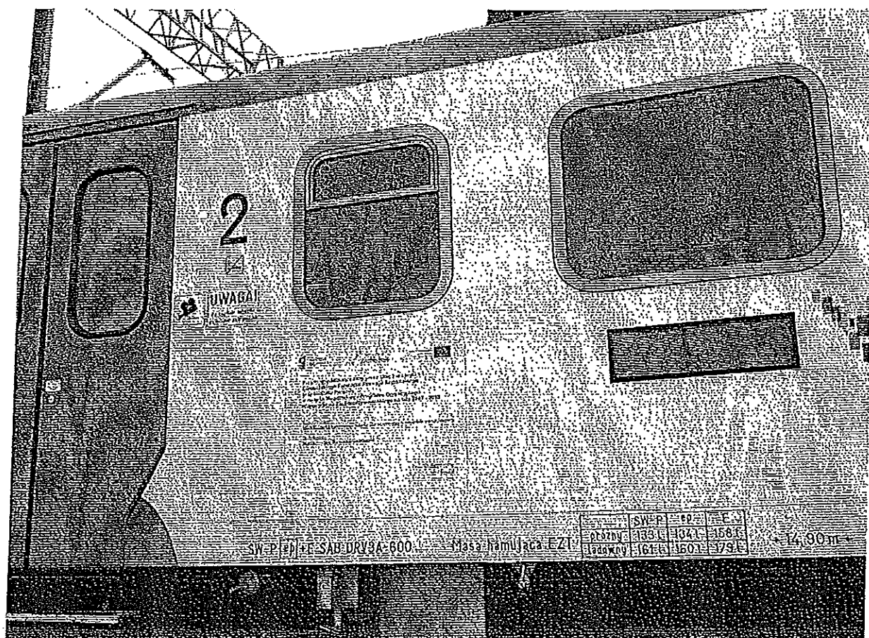
Naklejka pamiątkowa umieszczona na zewnątrz pojazdu.