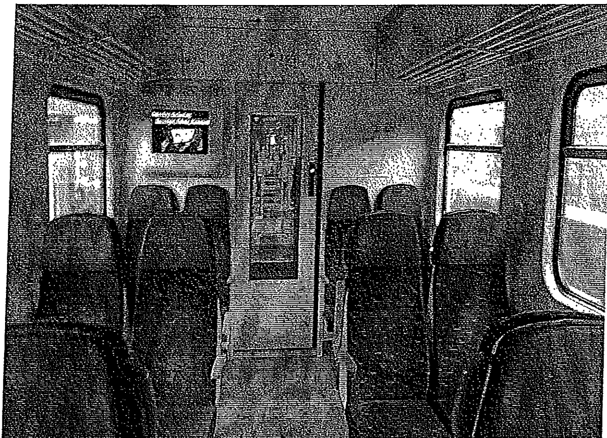
Zmodernizowane wnętrze pojazdu.