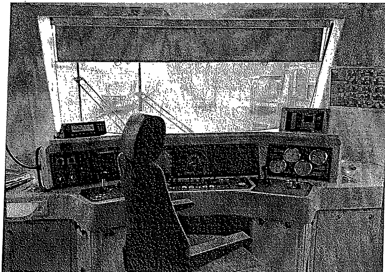
Zmodernizowane wnętrze pojazdu.