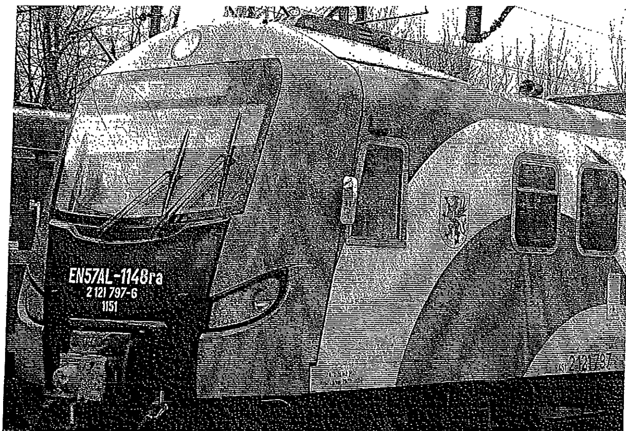
Pojazd EN57AL -1148.