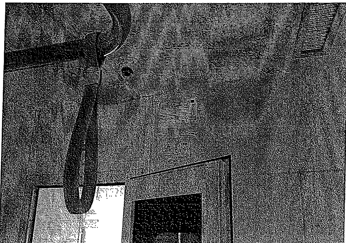
Naklejka pamiątkowa umieszczona wewnątrz pojazdu.