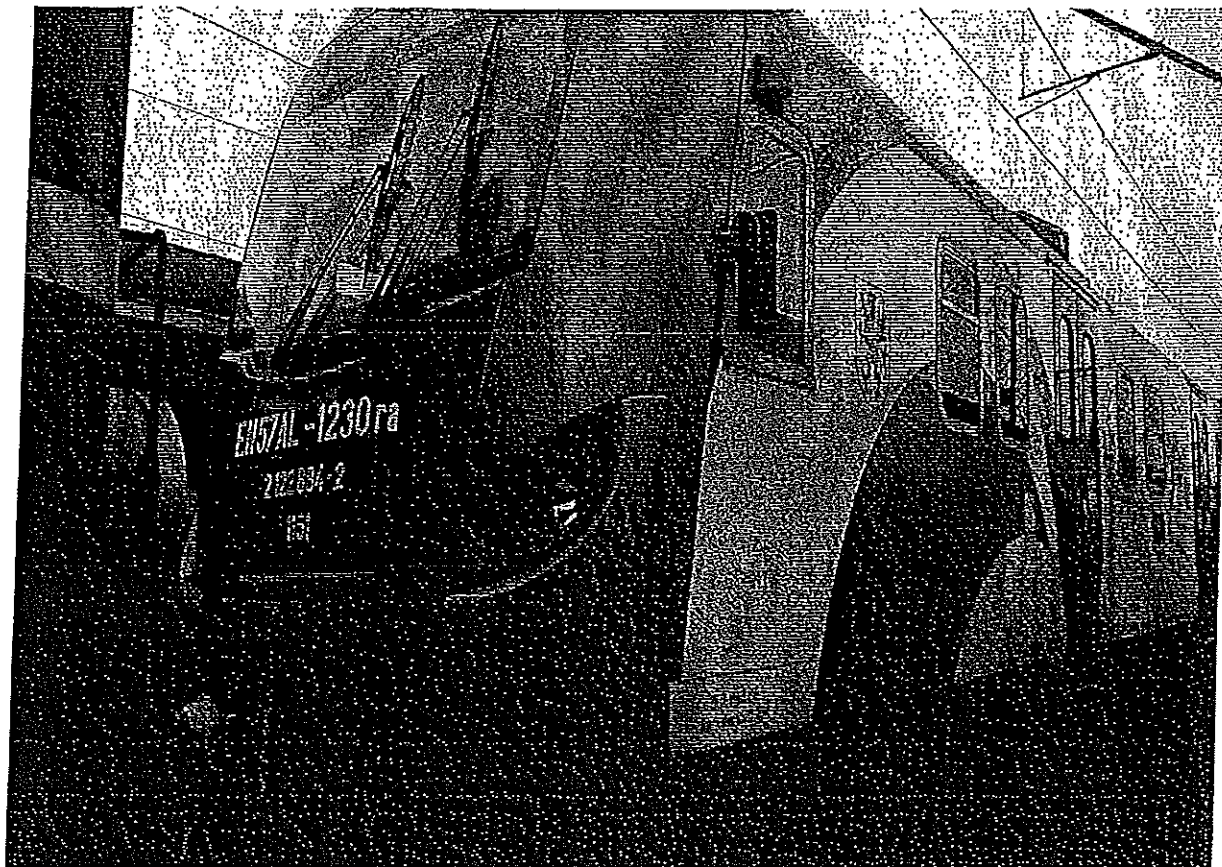
Pojazd EN57AL -1230.

Naklejka pamiątkowa umieszczona na zewnątrz pojazdu.