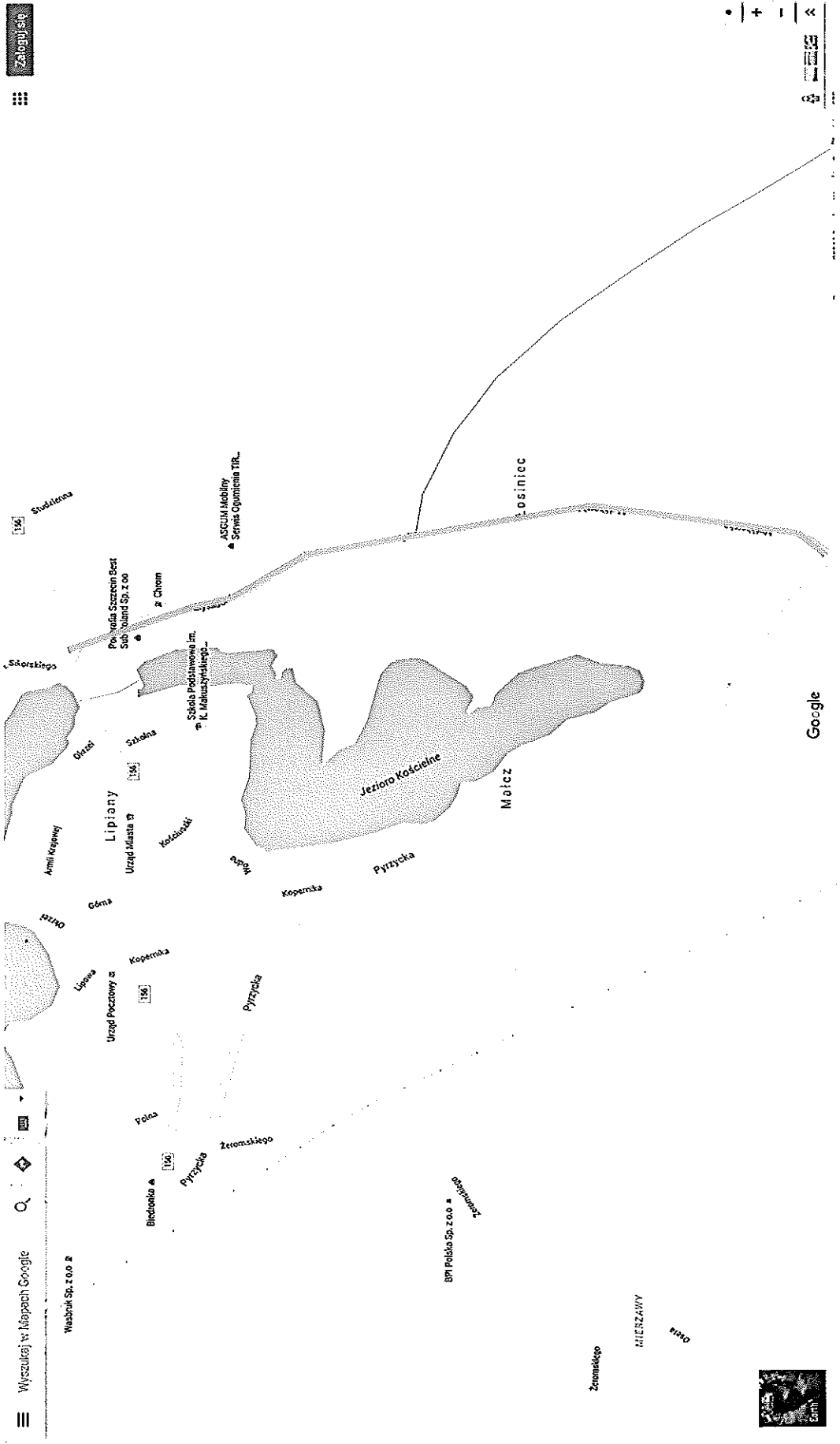
Mapa poglądowa dotyczy: przyjmowanego od powiatu odcinka drogi pow. nr 1572Z ul. Mysłiborska w Lipianach.

Odcinek dr. pow. nr 1572Z w Lipianach ul. Mysłiborska zaliczany do kategorii drogi wojewódzkiej.