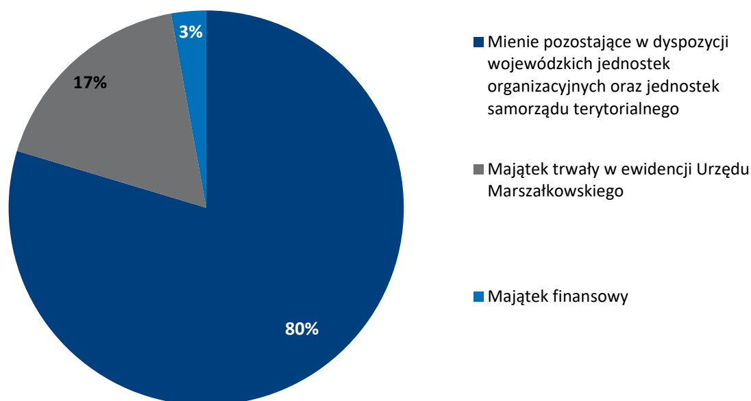
Wykres 1 Udział procentowy poszczególnych grup majątkowych w ogólnej wartości mienia Województwa