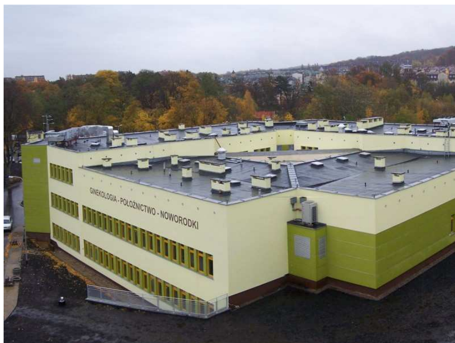
Rysunek 7 Centrum Opieki nad Matką i Dzieckiem w Zdrojach