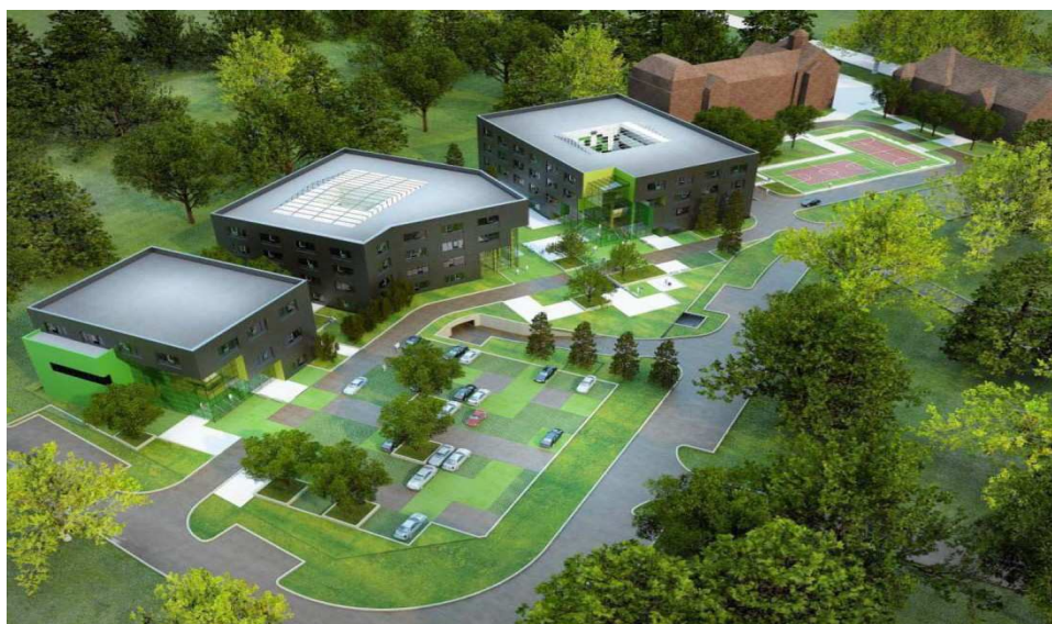
Rysunek 4 Wizualizacja trzech planowanych obiektów: Inkubator Technologiczny, Centrum Innowacji oraz Centrum Komputerowe