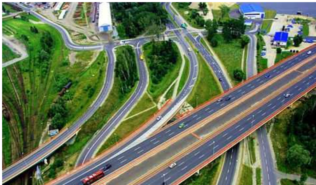
Rysunek 5 Obwodnica śródmieścia