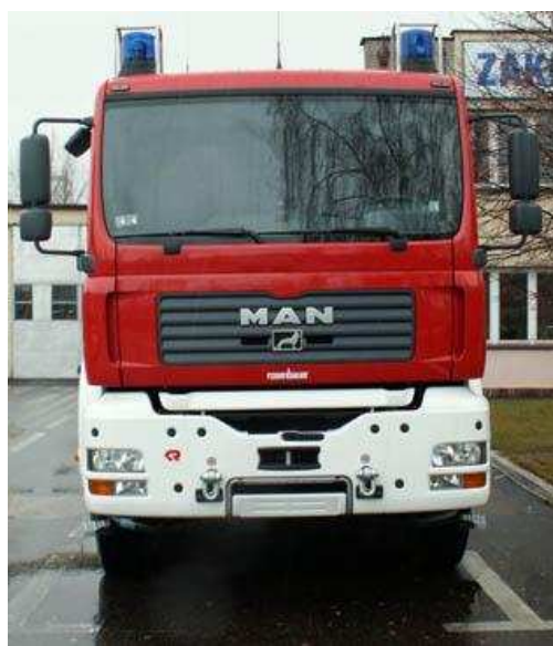
Rysunek 3 Pojazd ratowniczo - gaśniczy