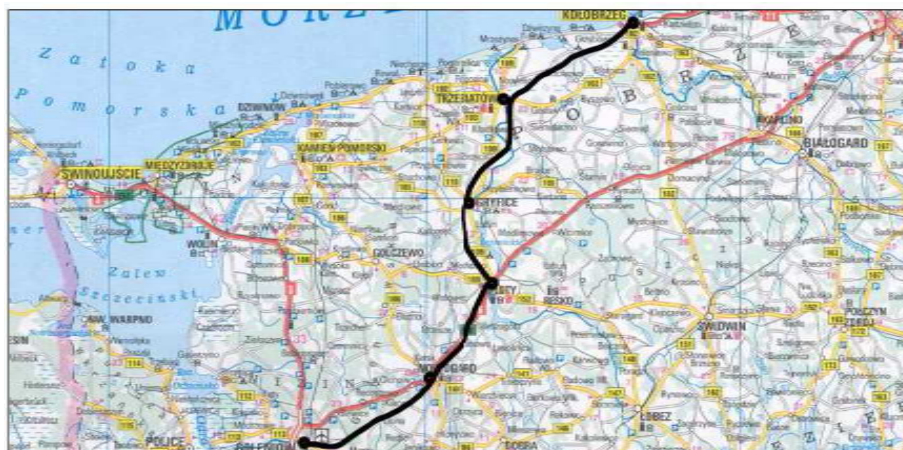
Rysunek 6 przebieg linii – powiaty: kołobrzegi, gryficki i goleniowski. Długość modernizowanego odcinka: 100,096 km - w tym na 33,441 km linia znaczenia państwowego (Kołobrzeg – Trzebiatów, Mosty –Goleniów)