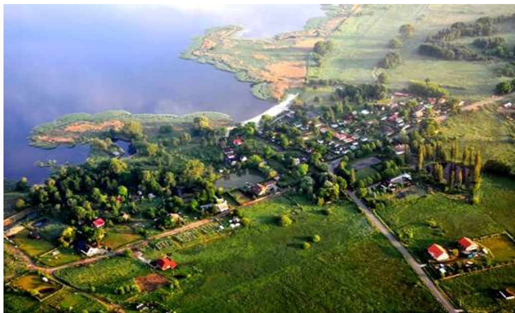
Rysunek 2 Budowa sieci kanalizacyjnej na terenie Aglomeracji Komarowo - Miejscowości Załom, Pucice, Rurzyca