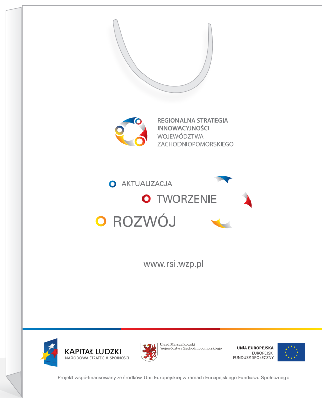
torba papierowa 23 x 8 x 30cm