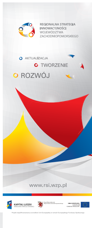
roll up, 80 x 200 cm